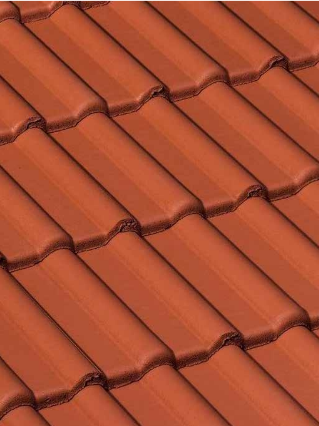
Double Romane Sienarot