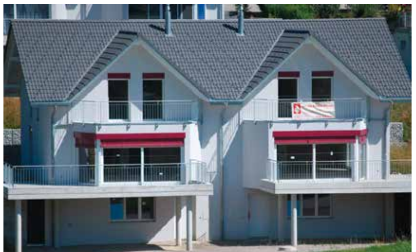
Double Romane Schiefergrau