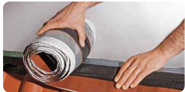
a) Figaroll Plus exakt an First oder Grat anlegen und ausrollen.