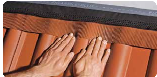
c) Dank der hohen Dehnbarkeit erleichtert Figaroll Plus ein exaktes und leichtes Anformen, auch bei stark profilierten Dachpfannen.