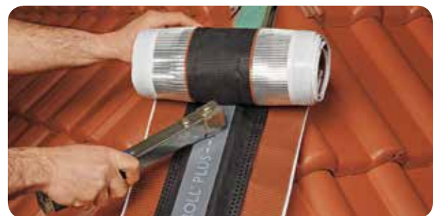
b) Figaroll Plus durch den Nagelstreifen auf der First- oder Gratlatte befestigen.