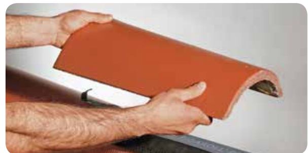
d) Firststein oder -ziegel mit Firstklammer auf der Firstlatte befestigen.